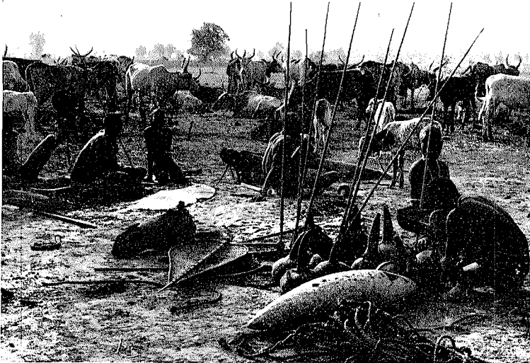
Abb. 1. Ein Nuer-Viehlager in der Nähe von Fulita

Während die Nuer in der Regenzeit ihr Vieh in Hofnähe halten, legen sie in der Trockenzeit Viehlager an, deren Standort sich nach den jeweiligen Futter- und Wasserverhältnissen richtet und von Zeit zu Zeit verändert wird. Bei der Errichtung eines solchen Lagers werden auf einer nahezu kreisrunden Fläche Holzpflocke im Abstand von etwa 2.5 m bis 3.5 m voneinander in die Erde getrieben. Mit einer Umzäunung wird das Lager nicht versehen