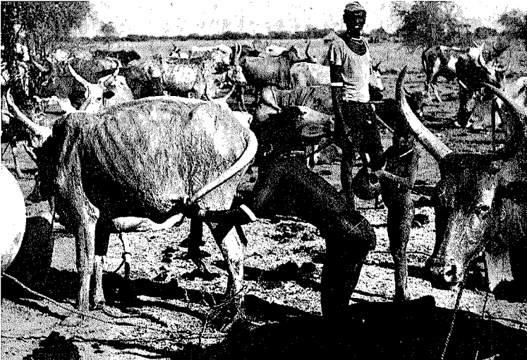
Abb. 3. Eines der Mädchen, die gelegentlich bei der Arbeit im Viehlager helfen, bläst einer Kuh Luft in die Scheide („Kuhblasen“). Dies hat nach Ansicht der Nuer einen größeren Milchertrag zur Folge